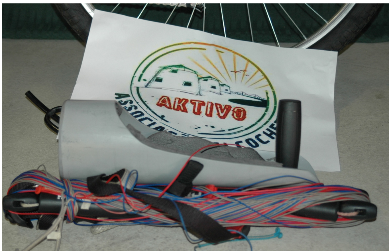
Adaptação para pessoas com incapacidades motoras ao nível do Braço