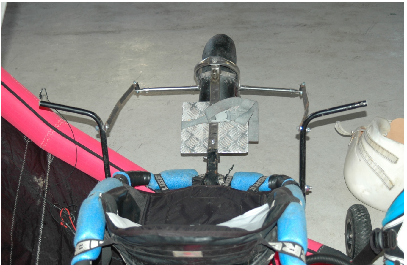
Buggy Adaptado para pessoas com incapacidade de membros inferiores