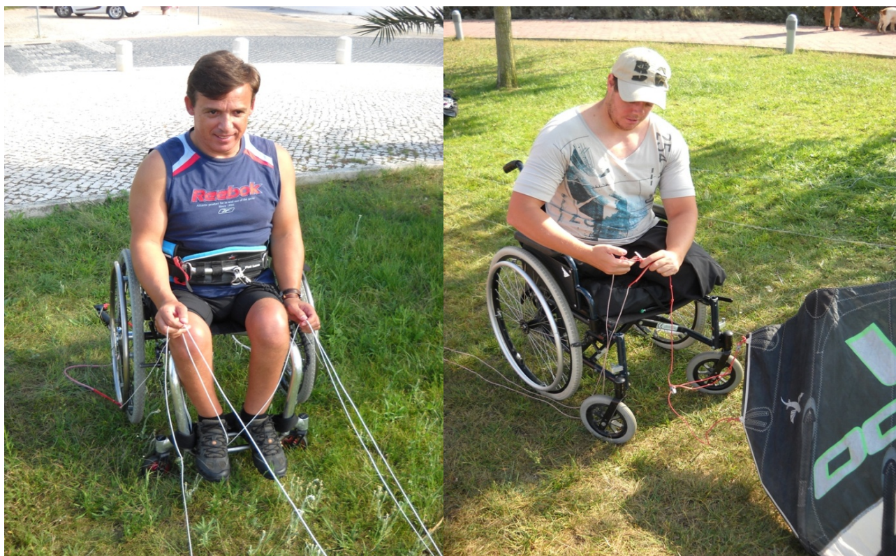
Treino de manobra da asa de kitesurf em cadeira de rodas na fase pré-setup