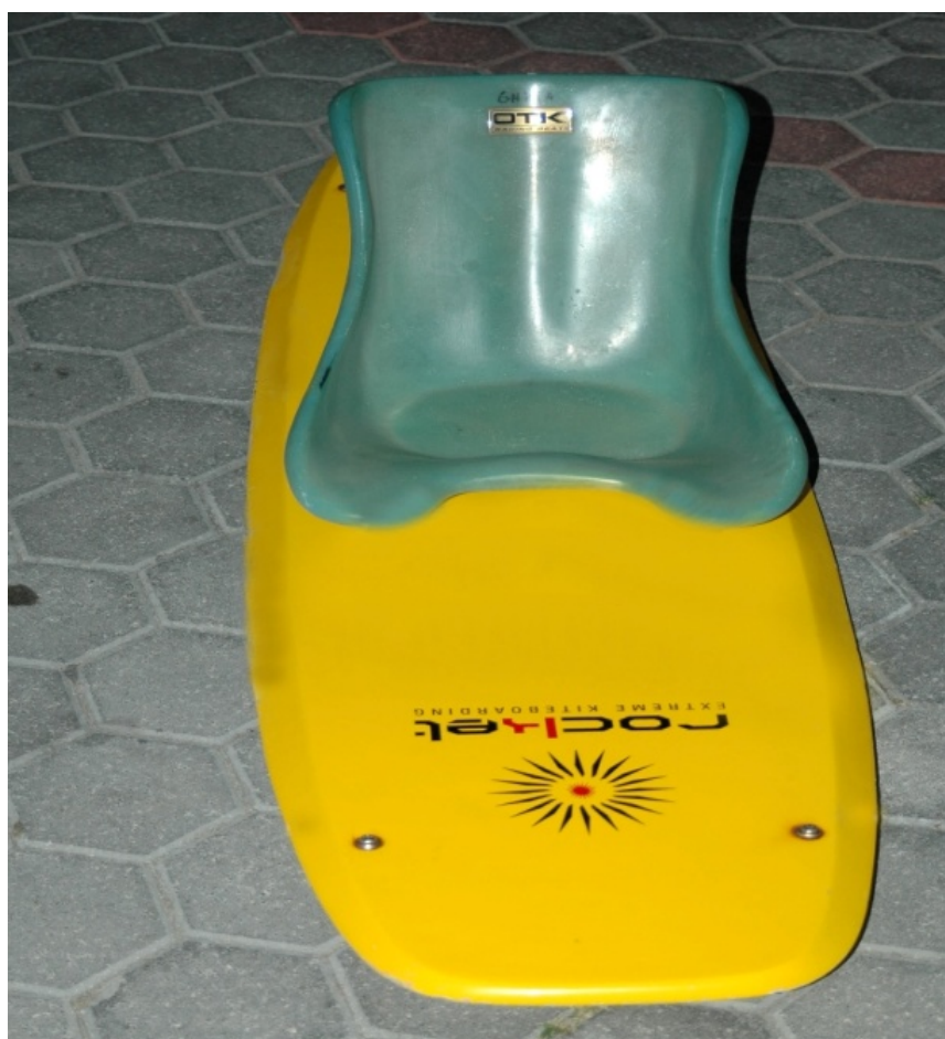
1º Mock-Up da construção da prancha

A prancha irá tornar possível a prática de kitesurf a pessoas biamputados e portadores de incapacidade de motricidade dos membros inferiores.